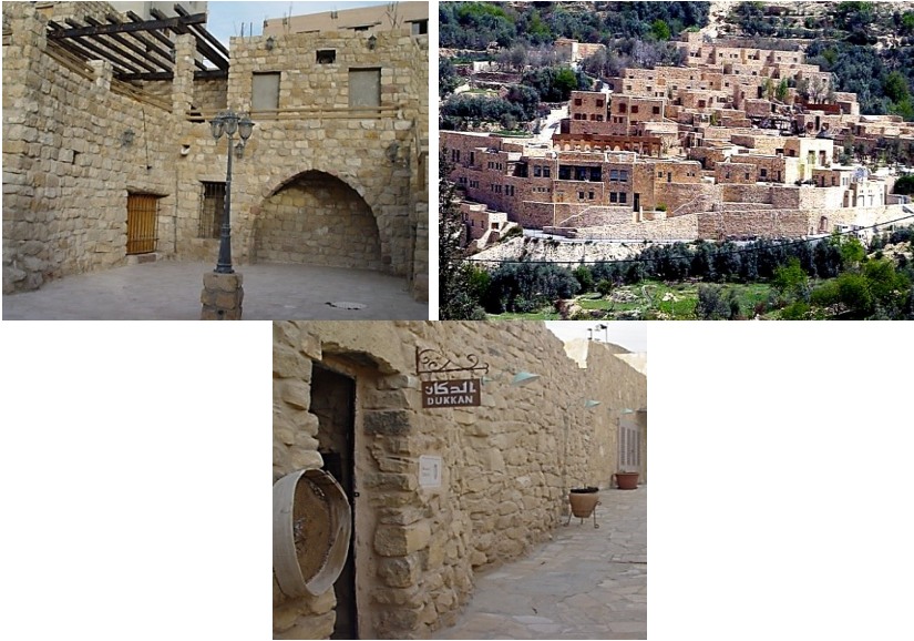
الشكل (10) قرية الطيبة التراثية

سكن هذه القرية بطون وأفخاذ قبيلة اللياثة: بنو عطا، والرواجفة، والشورور، والخليفات، والرواضية. وعرب اللياثة (بنو ليث) من القبائل التي يُرَجَّح أنها من بطون بني كنانة من مضر (Ammari, 2001). وقد كانت مسكناً لهم منذ العصور الوسطى وحتى أواسط القرن العشرين الميلادي حين اتجه أهل القرية إلى ترك منازلهم القديمة والاتجاه نحو المساكن الإسمنتية الحديثة، وقد عملت إحدى الشركات السياحية الوطنية على الاستعادة من مباني القرية القديمة، وطورتها لتكون مُنتجاً سياحياً يخدم القادمين لزيارة مدينة البترا من شتى دول العالم، والذين يتطلعون للتمتع بسحرها الأخاذ وألوان صخورها الوردية (Al-Abadi, 2006) (أنظر الشكل رقم: 10).