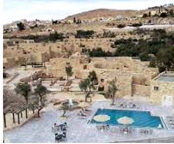
الشكل (12) قرية النوافلة التراثية (بيت زمان)