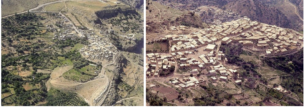
الشكل (9) قرية ضانا ومحيطها الطبيعية.