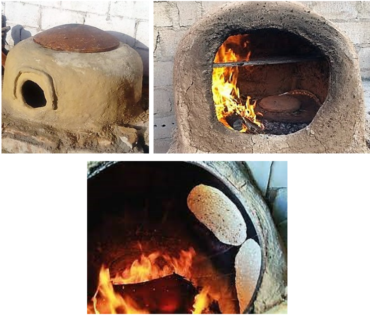
الشكل (8) الطابون.

الطابون: يُستعمل لصنع الخبز، يُصنع من طين الصلصال اللزج الممزوج بالتبن لكيلا يتشقق بعد أن يجف. غالباً ما يقتصر صنع الطابون على النسوة، حيث يقمن بصنعه على شكل قبة نصف دائرية لها فتحة علوية دائرية لإدخال أقراص العجين منها إلى داخل الطابون، في حين أن قاعدة الطابون المسطحة تُثبت على الأرض (أنظر الشكل رقم: 8)، ويوضع عليها حجارة صغيرة مكورة الشكل وأكبر قليلاً من بيض الحمام الداجن تُسمى (الرُصْف)، تقوم المرأة قبل صنع الخبز بوضع الجلة الجافة (روث الحيوانات) كوقود على أطراف الطابون وتشتعل فيها النيران (Palmer, 2008)، وبعد أن يحمى الطابون يُصبح جاهزاً للخبز فيه. وغالباً ما تستغرق مدة نضوج الخبز في الطابون ما بين ربع إلى ثلث الساعة. هنالك دراسة سسيواركيولوجية ضافية للطوابين أعدها الباحث ضيف الله العبيدات (Al-Obiedat, 2010) يُمكن الرجوع إليها والإفادة من معلوماتها الثرة.