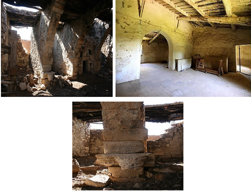
الشكل (4) السقف.

المدخل أو البوابة: للبيت الريفي مدخلٌ واحدٌ بعرض متر وبارتفاع مترين، ويُبنى من حجارة مشذبة، عند قاعدته درجة تُسمى (الدّواسة)، وسقف جزئه العلوي يُسمى (العتبة)، وعادة ما تُبنى العتبة من حجر واحد مستطيل الشكل طوله يُساوي عرض المدخل. وأحياناً تُبنى العتبة على شكل قنطرة صغيرة تُكسب المدخل أو البوابة مهابةً وجمالاً، وفي كلتا الحالتين يوجد فتحة صغيرة فوق العتبة تُسمى (طاقة) من أجل الإنارة والتهوية، أحياناً تعلو العتبة بلاطة حجرية منقوشٌ عليها اسم مالك البيت وسنة البناء، أو عبارة المالك لله الواحد القهار، أو هلال يحتضن نجمة خماسية وهذا يعد من رموز التراث الإسلامي العثماني.