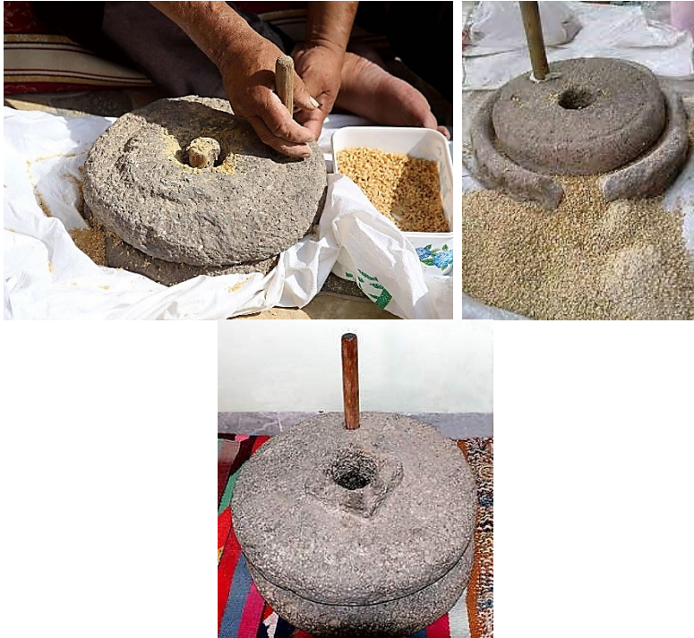
الشكل (7) حجر الرحى.

الرحى: وهي أداة حجرية تتألف من قطعتين من الحجر دائريتي الشكل تُستعمل لجرش الحبوب وصنع الجريشة، نصف قطر كلٍ منهما (20-30 سم) وبارتفاع (7 سم)، يُثبت في الجزء العلوي من الرحى قطعة خشب لتكون مقبضاً لليد حين الاستعمال، ويوجد في مُنتصفها فتحة دائرية نصف قطرها (6 سم) لوضع الحبوب أثناء عملية الجرش، يُثبت الجزء العلوي على الجزء السفلي الذي يخرج من مركزه وتدّاً بارتفاع (15 سم) والغرض من ذلك حفظ الجزء العلوي وجعله مُنطبقاً على الجزء السفلي تماماً أثناء عملية الجرش تقوم المرأة بتحريك الجزء العلوي للرحى بشكل دائري لتخرج الحبوب مجروشة من بين حجري الرحى (أنظر الشكل رقم:7).