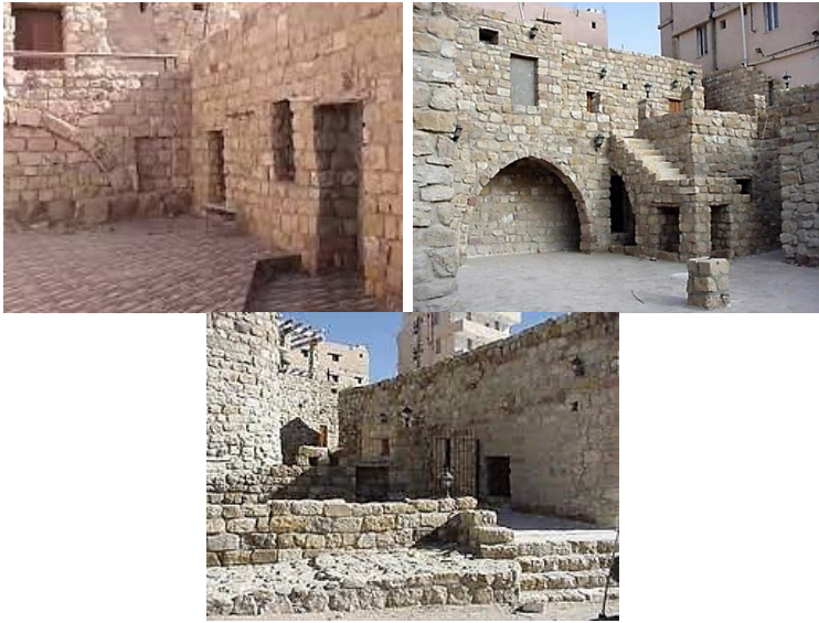
الشكل (13) قرية إلجي التراثية

نجحت سلطة إقليم البترا في امتلاك ما تبقى من دور إلجي، وقامت بترميمه، والحفاظ عليه، وتحويله إلى سوق للحرف اليدوية التي يُقبل السياح الأجانب على شرائها كتذكارات يحملونها إلى بلدانهم لتذكيرهم بزياراتهم للأردن وبترا الأبناط (أنظر الشكل رقم: 13).