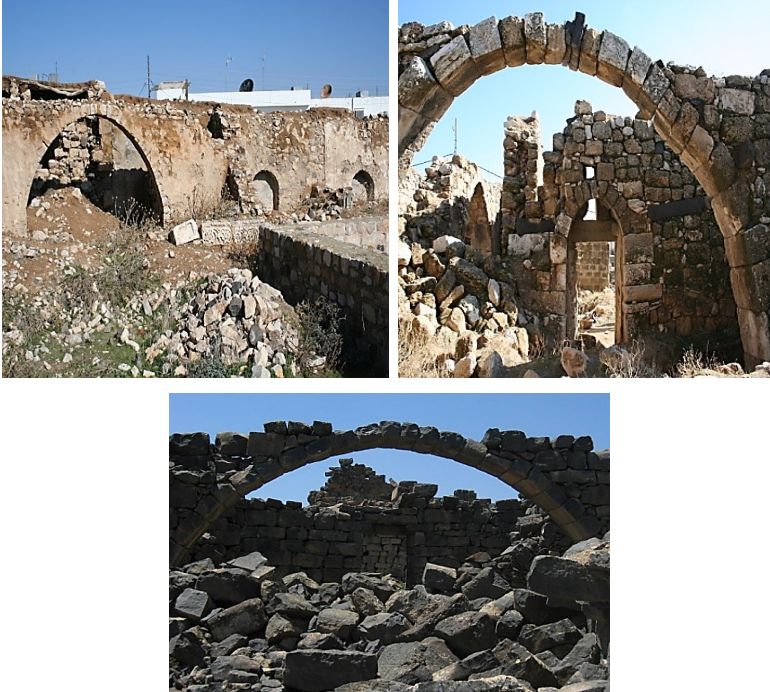
الشكل (3) القناطر أو العقود.

القناطر أو العقود: إذا أراد القروي أن يبني بيتاً واسعاً فلا مناص البتة من بناء القناطر لكي تزيد في مساحة البيت وتُساعد في حَمَل السقف، تُبنى القناطر عادة داخل البيت، وهي أقواس عالية تدعمها من الخلف ركائز من الحجارة والطين، وتُدعى كل ركيزة منها (عقب القنطرة)، عادة ما تُبنى القناطر من حجارة مهذمة (مُشذبة) ومستطيلة الشكل تُصَف إلى جانب بعضها بعضاً، ويرفدها من الجهة السفلية أثناء عملية بنائها أكياس من التبن والقش لتحافظ على ثباتها واستدارتها ريثما يكتمل البناء. ينتهي بناء القنطرة بوضع حجر الغلق (Key Stone) الذي يُحکم بناء القنطرة ويؤدي إلى تماسكها، يتفاوت عرض القنطرة ما بين صفٍ، أو صفين، أو ثلاثة صفوف من الحجارة المستطيلة الشكل والمُشذبة بشكلٍ حسن (أنظر الشكل رقم: 3).