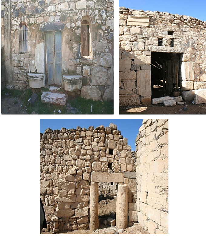
الشكل (5) المدخل أو البوابة، وإعادة استخدام حجارة المواقع الأثرية.

إعادة تأهيل القرى التراثية وتوظيفها في تنمية السياحة المستدامة: نماذج من جنوبي الأردن حمزة مزلوه المحاسنة، مسلم رشد الرواحنة