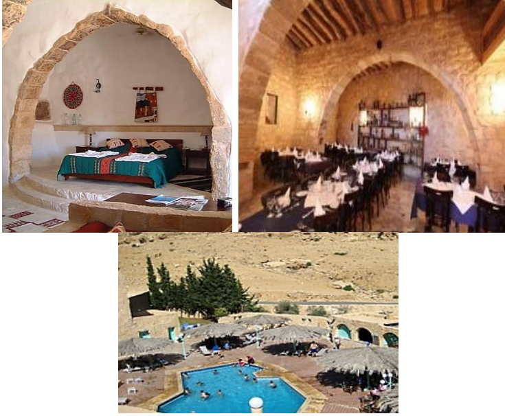
الشكل (11) بعض مرافق منتجع طيبة زمان

وباللغتين العربية والإنجليزية (المصدر الدكتور سليمان الفرجات مدير محمية البترا سابقاً) (أنظر الشكل رقم: 11).