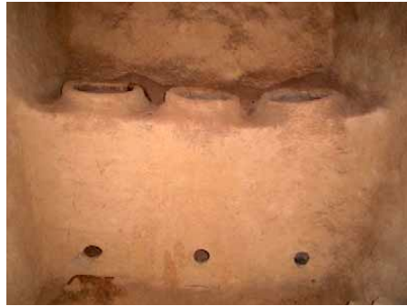
الشكل (6) نماذج من الكواير المتحركة والثابتة.

هنالك دراسة قيمة في صُلب موضوع الكواير أعدها الباحثان وائل الحجاج ومحمود النعامنة (Al-Hajjaj & Al-Naamneh, 2016). إن فكرة خزن الغلال والحبوب وادخارها لقادم الأيام ليست وليدة أيامنا هذه بل تعود في بداياتها لمطلع العصر الحجري الحديث حيث كان الإنسان يخزن الفائض من الغلال في حفر أسطوانية الشكل دون مستوى سطح أرضية المنزل وتُبنى حُفر التخزين هذه من حجارة سبه مهندمة ومشذبة ( Abu-Ghanimeh, 1995 & 2006; Mahasneh, 2004; )